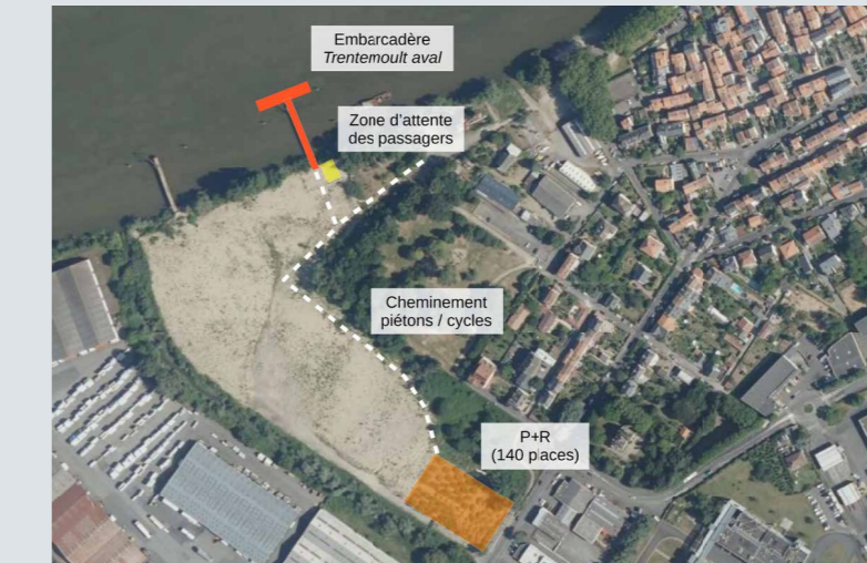
Schéma d'implantation du Pôle intermodal Trentemoult-Aval

Le projet envisagé fait suite à une étude de faisabilité sur l'aménagement de « Trentemoult-Aval » engagée dès 2020 par Nantes Métropole, en lien avec les différents acteurs du fleuve et la Ville de Rezé.