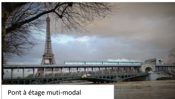
Pont à étage multi-modal