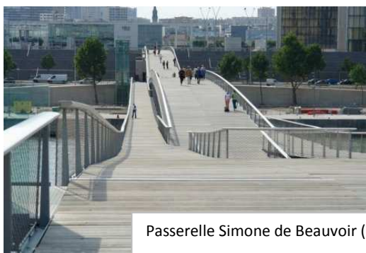
Passerelle Simone de Beauvoir (Paris)