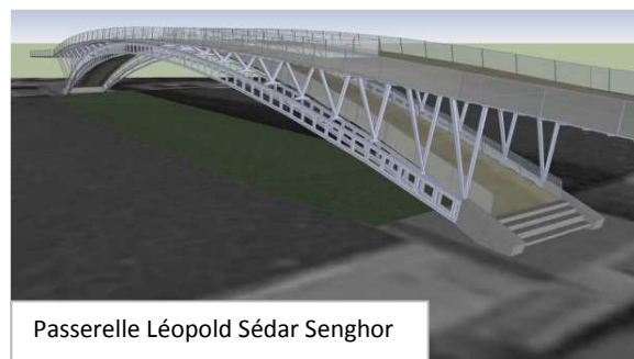
Passerelle Léopold Sédar Senghor