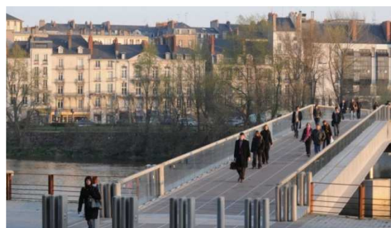
Passerelle Schœlcher (Nantes) - en dissociant piéton et vélo